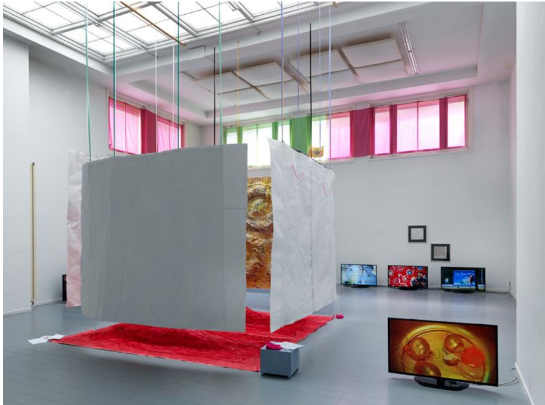
Werk van Taocheng Wang op Offspring 2014