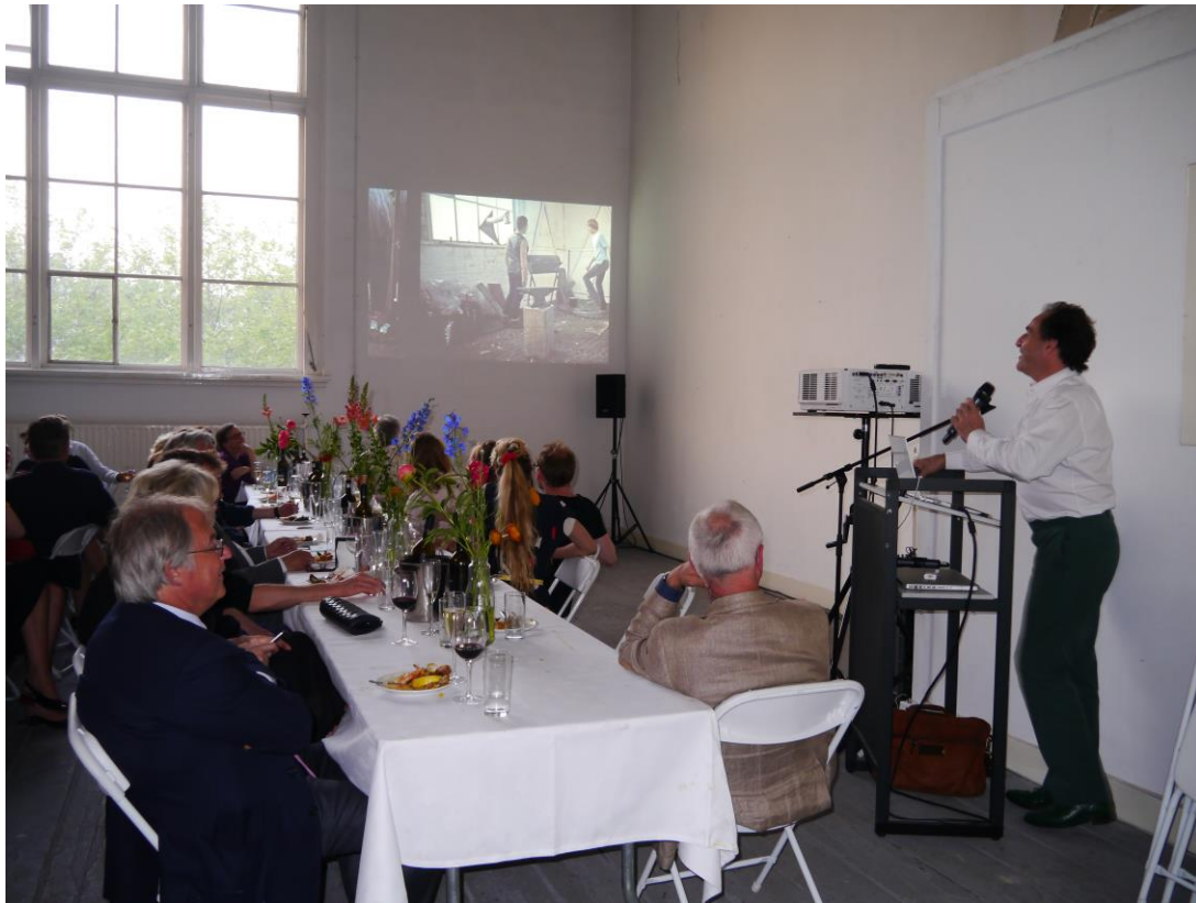
Joep van Lieshout eregast op het ASF Diner