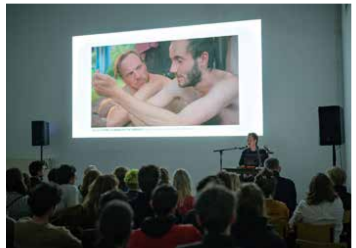
Lezing Ben Russel in januari 2020 ism Sonic Acts.

In februari vond in samenwerking met Sonic Acts Festival een goedbezochte artist talk en een driedaagse filmworkshop met de Amerikaanse filmmaker en beeldend kunstenaar Ben Russell plaats. Vier deelnemers van De Ateliers namen deel aan de workshop, die bij De Ateliers werd gehouden en waarin 15 jonge filmmakers onder leiding van Russell het onderwerp van perceptual engagement