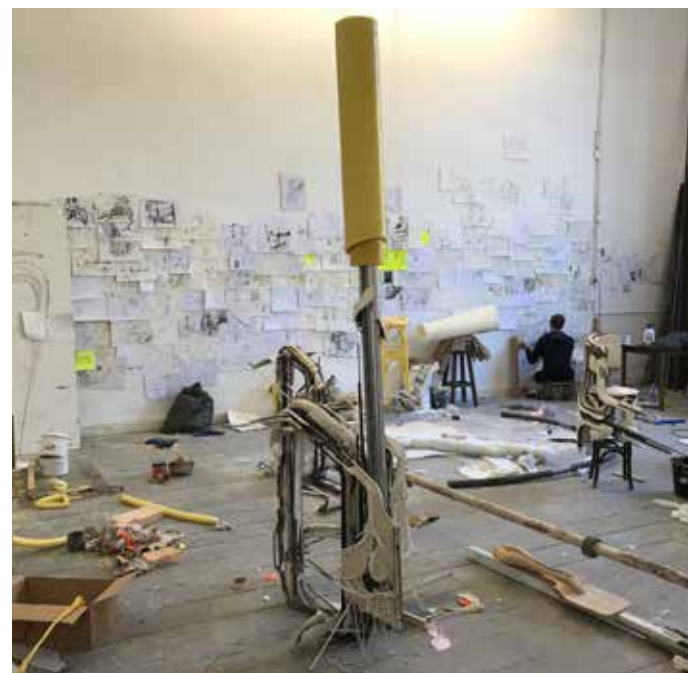
Deelnemer Jan Hüskes in zijn studio

Zo'n twintig deelnemers aan De Ateliers werken gedurende twee jaar in een eigen atelier en worden begeleid door internationale kunstenaars die wekelijks atelierbezoeken afleggen. Elk jaar vertrekken ca. tien deelnemers en komen er ca. tien nieuwe bij. In 2020 werkten in totaal 31 verschillende deelnemers op De Ateliers, onder wie 19 vrouwelijke kunstenaars, 11 mannelijke kunstenaars en 1 non-binary kunstenaar. (Ter verduidelijking: bij De Ateliers werken altijd ca. 20 kunstenaars – 10 eerstejaars en 10 tweedejaars. In 2020 zwaaiden er per 1 oktober 10 kunstenaars af, gingen er op dat moment 10 van het eerste naar het tweede jaar, en begonnen er 10 nieuwe eerstejaars. Elk kalenderjaar zijn er dus ca. 30 kunstenaars actief geweest). Negen van de eenendertig kunstenaars hebben de Nederlandse nationaliteit of waren bij aanvang van hun werkperiode al langer dan twee jaar in Nederland woonachtig, 22 van hen zijn afkomstig uit het buitenland. Eén deelnemer, gestart in september 2019, besloot hun werkperiode voortijdig te beëindigen per 31 december 2020, waardoor het kalenderjaar 2020 werd geëindigd met 20 deelnemers.